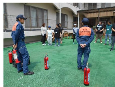
防災訓練(消火器訓練)