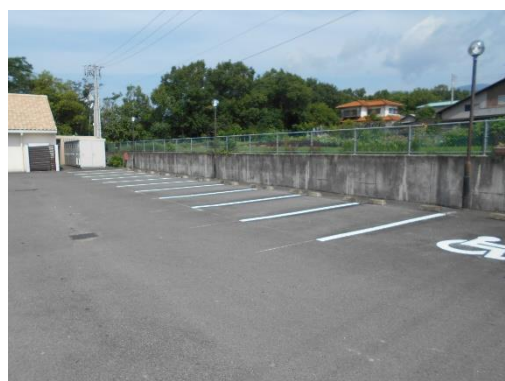
駐車場ライン引き工事(着工後)