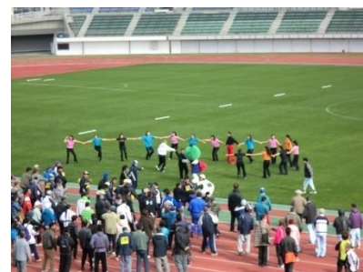
ゆうあいスポーツ四国大会