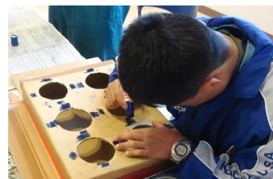
【外部委託】アルミ材の組み立て