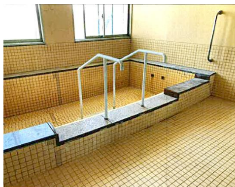
浴室段差解消・その他改修工事 (着工後)